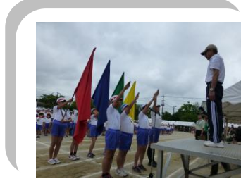
(応援団長による誓いの言葉)

朝早くから運動場の整備にご協力いただいた保護者、地域の皆様、心から感謝申し上げます。本当に有り難うございました。そして、開会を辛抱強く待っていただき、最後まで温かいご声援をいただいた保護者や地域の皆様、本当に有り難うございました。