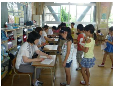
【子どもクッキング教室の様子】