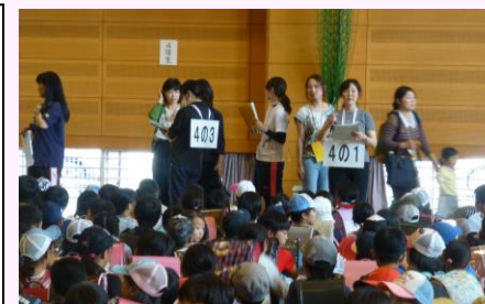
【引き渡し訓練の様子】

たくさんのご意見を整理する中で成果と課題が見つかりましたが、最も効果的なのは『続ける』ことだと思います。今回お寄せいただきましたご意見は、来年度の計画に生かしていきます。