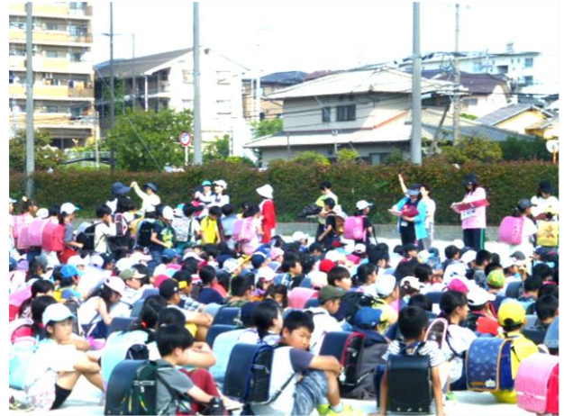
「おはしも」の約束で避難する子供たち

5月15日（水）地震を想定した避難訓練及び保護者引き渡し訓練を行いました。前回からの改善点は、①簡易な準備、②直接引き渡し、③一方通行の動線でした。暑い中の訓練でしたが、スムーズな引き渡しができたとおもいます。緊急の際は、人やものの不足等が考えられます。そのような状況で、子供も大人も落ち着いて行動することが大切です。年に3回の避難訓練を実施して、子供たちの安全力を高めていきます。ご協力ありがとうございました。アンケートをもとに改善して参ります。