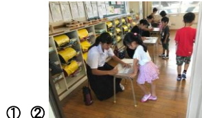
ラ① 支② 援③ 地④ 域⑤ と⑥ の⑦ 交⑧ 流 の 継 続 的 な サ マ リ ス ク ー ル シ ニ ア 学 習