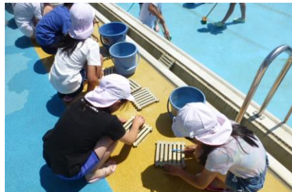
細かな汚れも丁寧に