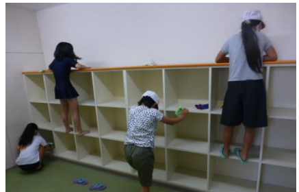
隅々の汚れまで逃しません！

本校では、子供たちの「健康」と「安全」を第一に、水泳指導をしていきます。 特に水泳学習がある日は、保護者の皆様にお子様の健康観察を丁寧にさせていただき、必要事項の記入・押印等をした「プールカード」を学校へ持たせてください。 学校では、この「プールカード」をもとにお子様の健康状態を把握しています。 「プールカード」を忘れた場合及び押印等のない場合はプールに入ることができません。 ご協力をよろしくお願いいたします。また、本年度感染症対策のため、学年合同での学習ができません。そのため、学習回数が少なくなることもご理解ください。各学級3回を予定しています。