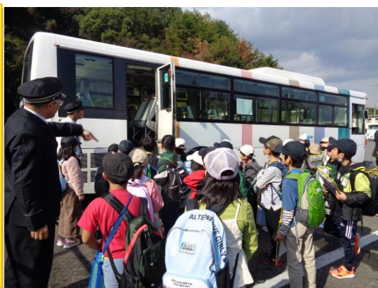
2年生生活科 くバスにのろうく