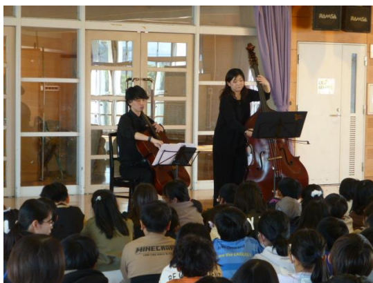
「音楽の玉手箱」くチェロと コントラバスの音色く

今年もあと1ヶ月になりました。「わくわく」を見つけながら、今年の締めくくりをしていきたいと思います。