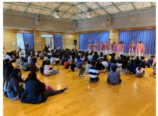
(クリスマスコンサート)

今年度も、地域の皆様をはじめ、PTA・おやじの会・リリース・かすがっ子おはなし会の皆様が育成部の一員として温かく支えてくださったおかげで、子供達は学力・心力・体力・安全力を着実に高めることができました。行事や日々の活動では、多くの大人の皆様に見守られたことで、子供達は安心して挑戦し、さまざまな場面で自信を育むことができました。振り返りには、地域の方々やご家庭への感謝の言葉が数多く書かれており、そのつながりの深さと温かさを改めて実感しました。また、学校運営協議会を中心とした連携のもとで、それぞれが役割を果たしながら活動を進められたことは、大きな力となりました。皆様の思いや支援が子供の成長につながっていることに、心から感謝申し上げます。来年度も、子供達の未来を見据え、地域・家庭・学校が一体となって温かく支え合い、より豊かで意義ある学びの場を共につくっていかれると思います。