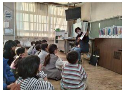
(かすがっ子おはなし会)

「親子弁当の日」では、保護者と一緒に弁当作りを楽しみ、食の大切さを再認識する機会となりました。また、これから自分で料理にチャレンジをしてみようという意欲を高めることができました。